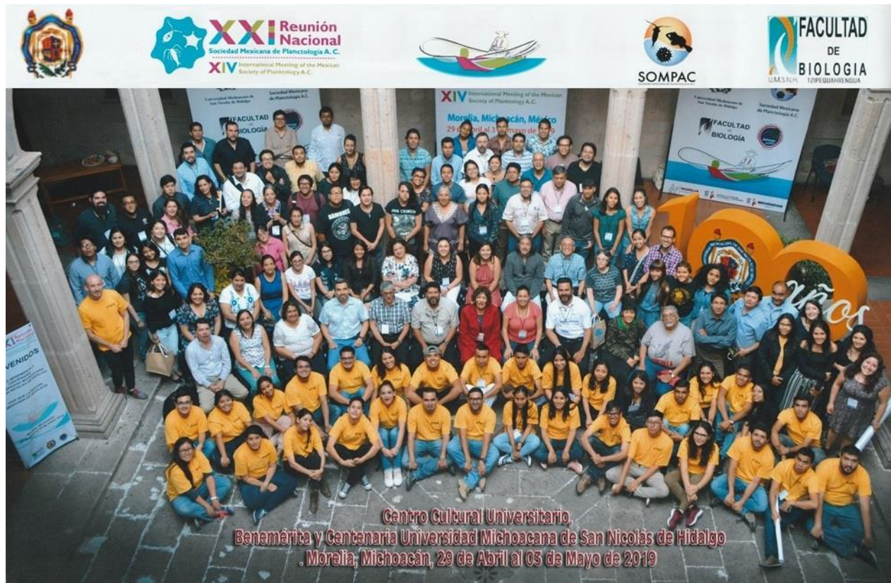
Figura 3. XXI Reunión Nacional de la Sociedad Mexicana de Planctología A.C y XIV International Meeting of the Mexican Society of Planctology A.C. realizada en Morelia Michoacán, México, 2019.